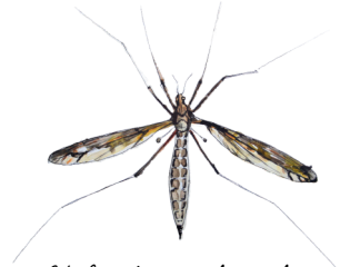
Kaltiohärmäkirsikäs Tipula fendleri