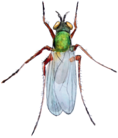
Kolikkokiiluri Dolichopus planitarsis