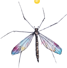
Morostokirsikäs Dicranota subtilis