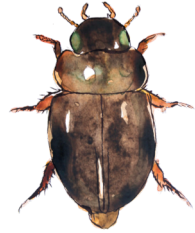
Pyörörutavesiäinen Amacaena globulus