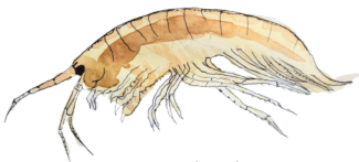
Järvikatka Gammarus lacustris