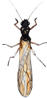
Etelänkoipikorri Nemoura dubitans