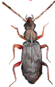
Lähdepurolaakanen Lesteva punctata