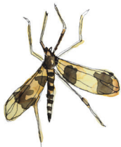
Lähdeparvekas Erioptera pederi