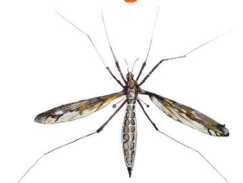
Kaltiohärmäkirsikäs Tipula fendleri