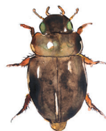
Pyörörutavesiäinen Anacaena globulus