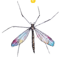
Morostokirsikäs Dicranota subtilis