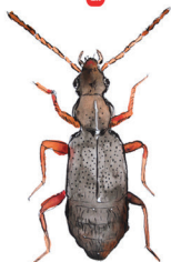
Lähdepurolaakanen Lesteva punctata